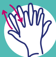
Paume sur dos et vice versa, désinfection entre les doigts