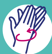
Paume contre paume