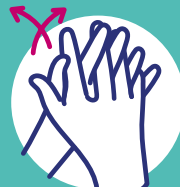
Paume contre paumes avec les doigts entrelacés