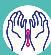
La tranche des mains et les poignets