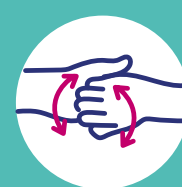
Doigts en crochets désinfection des doigts