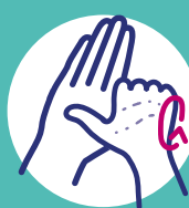
Désinfection des pouces