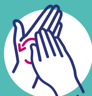
Pulpe des doigts dans la paume opposée, désinfection des ongles